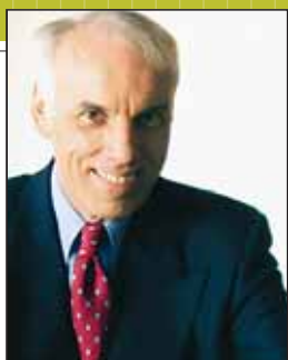
Gaétan Boucher , président-directeur général de la Fédération des cégeps