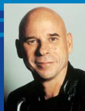
2001 Guy Laliberté Président fondateur Cirque du Soleil

Des entrepreneurs émérites ont accepté de présider les différentes éditions du Concours québécois en entrepreneuriat. En voici quelques-uns.